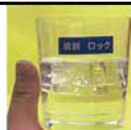
アルコール度数25%以上